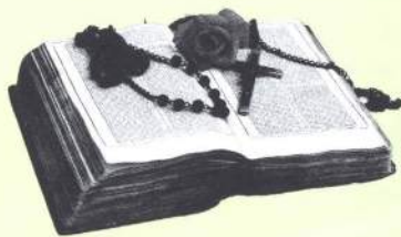
(Padre Nuestro, Ave María)